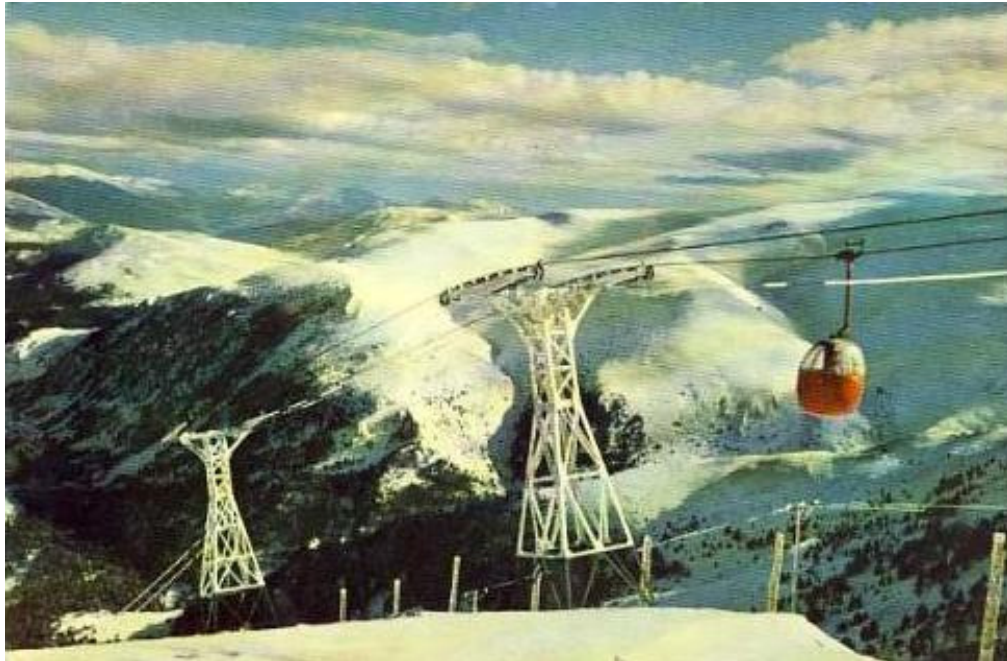
Postal del telecabina al Puig d' Alp (Campanã, S.II, no. 1040)