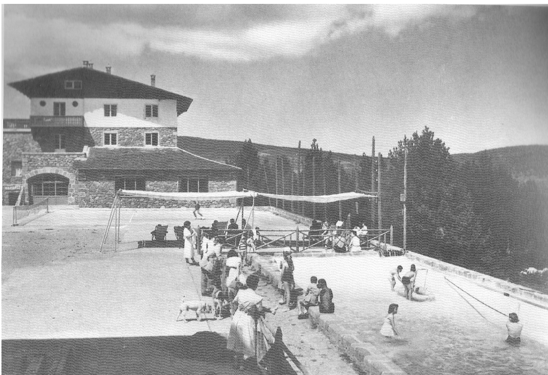
1962, un hostel a Font Canaleta.