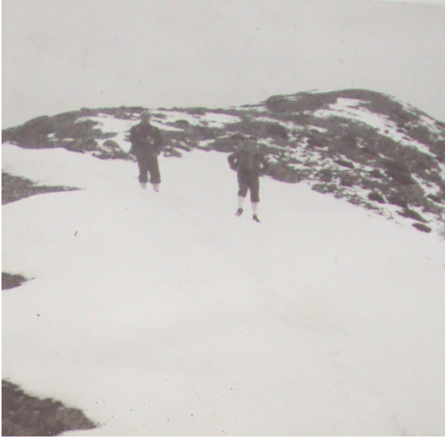
Pujant al Puig d'Alp

Els tècnics de l'EEE, havent realitzat un detingut estudi comparatiu d'ambdós estils i tècniques, optaren finalment per aquesta última, majoritàriament.