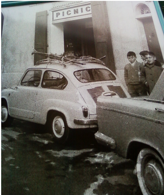
Anant a esquiar en aquells SEAT 600 o 1500...