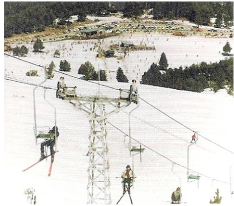
Cadira que pujava a Costa Rasa des del Coll Sisè