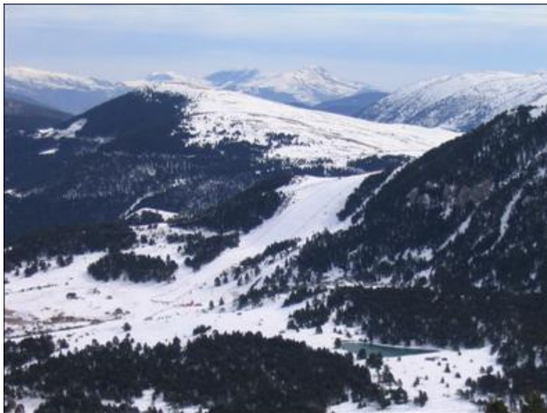
Zona baixa de l'estació des de l'Olimpica