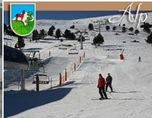
Antigues postals de La Molina. La de BiN representa 4 pistes de La Molina i el Puig d' Alp, i és feta per n'A. Zerkowitz