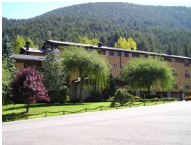
Hotel Roc Blanc