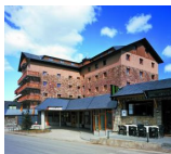
Hotel Solineu (J.Muñoz)