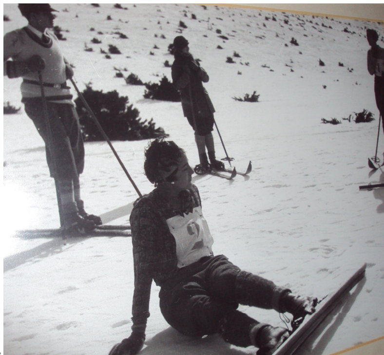
Curses i descans