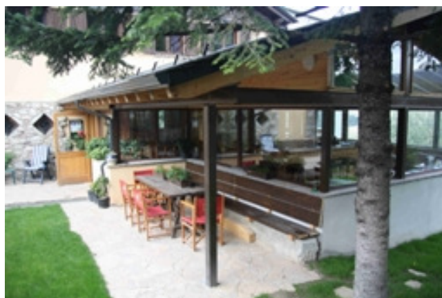
Xalet refugi Pere Carné, foto del 3-8-2008

Més recentment, les grans cadenes hoteleres arriben a La Molina, introduint-se en un mercat que havia estat fins a fa tan sols 10 anys, exclusivament familiar. Tot el sector patirà un gir progressiu: s'inauguraran al nou Resort Alp 2.500, davant de la Pista Llarga, el Guitart La Molina Aparthotel Resort & Spa**** (any 2005) i el HG La Molina **** (any 2010), i a la collada el Gran Hotel Termes La Collada ****Sup. (any 2006, refent l'anterior hotel) i el Guitart Termes La Collada Wellness & Spa (any 2010).