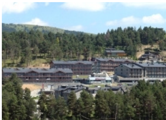
2008, Guitart La Molina Aparthotel & Spa

Més recentment, les grans cadenes hoteleres arriben a La Molina, introduint-se en un mercat que havia estat fins a fa tan sols 10 anys, exclusivament familiar. Tot el sector patirà un gir progressiu: s'inauguraran al nou Resort Alp 2.500, davant de la Pista Llarga, el Guitart La Molina Aparthotel Resort & Spa**** (any 2005) i el HG La Molina **** (any 2010), i a la collada el Gran Hotel Termes La Collada ****Sup. (any 2006, refent l'anterior hotel) i el Guitart Termes La Collada Wellness & Spa (any 2010).