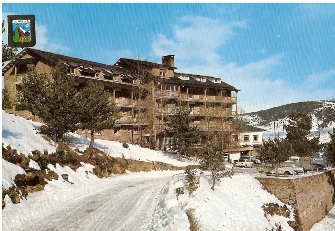
Hotel La Solana, +/- 1970.

O altres locals d'hostaleria com ara l'Hotel Rigat, gran esquiador i emprenedor, que construeix el que després serà Palace i Solineu, i que ampliarà ja en els '60. En parlarem abastament més endavant. O l'Hotel Roc Blanc, que no s'inaugura fins el 1969, de la