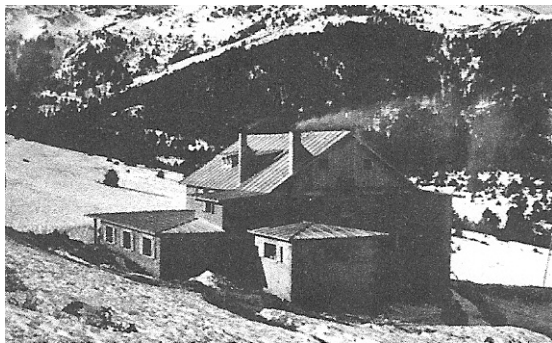
L'Hotel El Ciervo Blanco va ser inaugurat l'any 1942