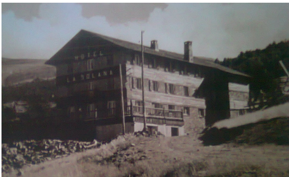
1953, Hotel La Solana