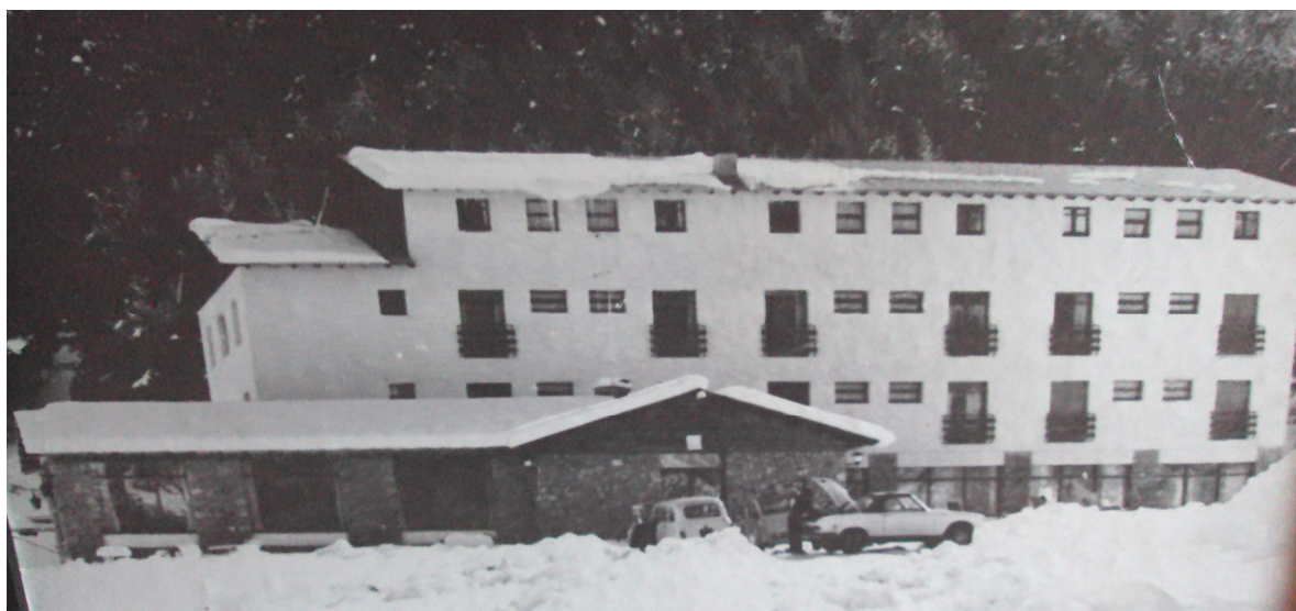
Hotel Roc Blanc cap el 1970