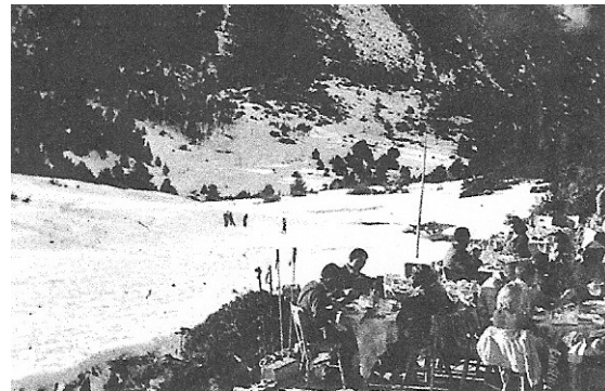
La concorreguda terrassa d'El Ciervo Blanco, a peu de pistes