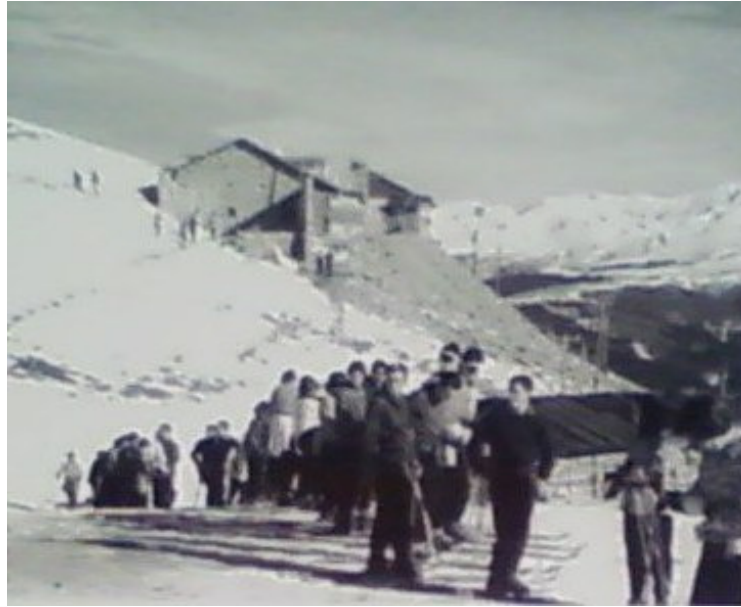
Antics edificis de TEPSA, avui encara magatzems per a retrac davant de Set Fonts