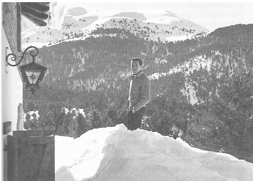
1951, març, Els Isards, després d'una gran nevada. La neu supera l'alçada de les finestres.