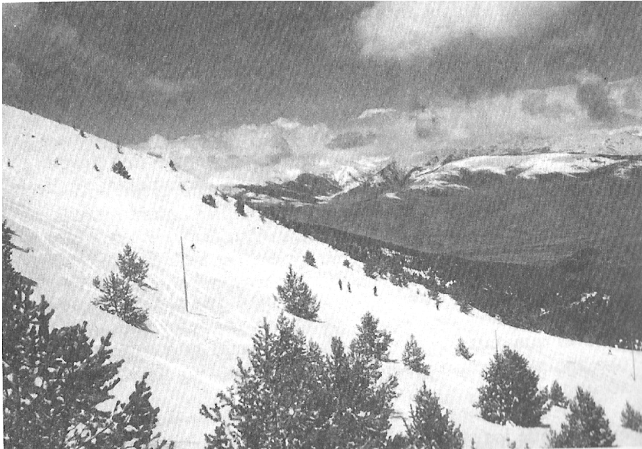
1960, Costa Rasa.

visigòtica de l'any 700 aprox, per sota de la mansió de Belfegor, el Niu dels Falcons, o ca'l Cordero), pujant cap a Supermolina o Font Canaleta, tot arrecerat dins la nova "Muntanya Sagrada", nom que li posen recordant la llunyana i original muntanya sagrada de Montserrat.