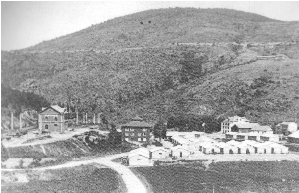
1948, barri de l'estació, amb l'estació, la casa vermella, els barracons...

L'any 1948 les nevades assoleixen categoria única: a diversos hotels s'entra per les finestres del segon pis, el tren no pot sortir de l'estació i La Molina quedà incomunicada dues setmanes senceres. El 1951 també va ser un any de neu excel·lent, superat pel 1956, on la neu natural arribà a mitjans de maig, quan uns grans allaus arrasaren la baixada del que avui és l'Estadi, fins al Trampolí, arrencant pins que no tornaren a créixer fins a mitjans dels '80.