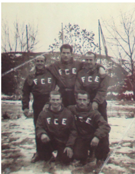
Esports d'hivern als '50