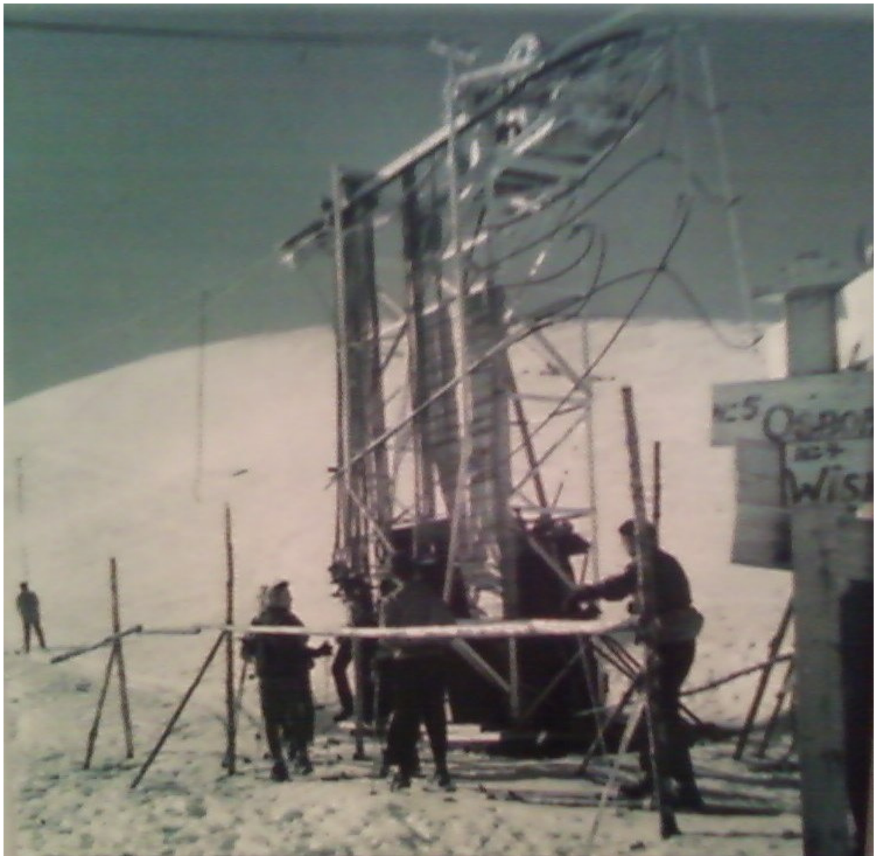
Remuntadors de la zona de la Tosa. Crec que és el primer telesquí del Puig d'Alp a la Tosa