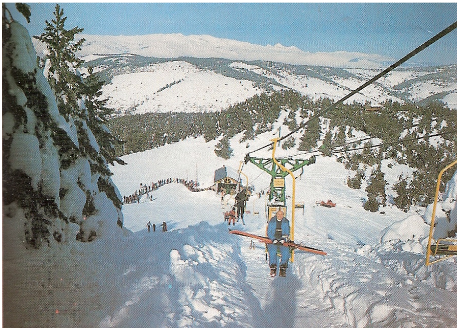
1962, el vell cadira de Costa Rasa, amb molt d'ordre a la cua.