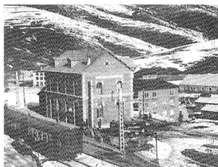
1948, l'estació vella i la casa vermella darrera, restaurant dels Planes