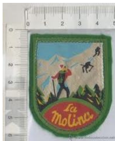
Escut brodat de 6 x 4'5 cms.