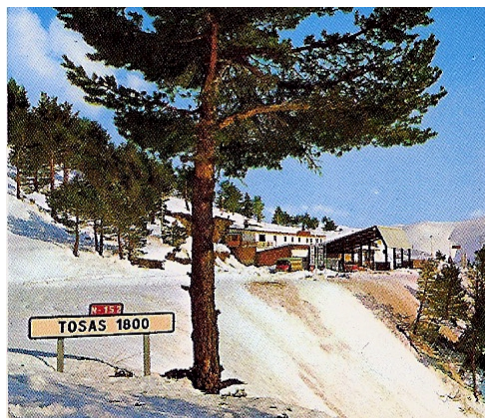
1964, collada de Toses, 1800 m.