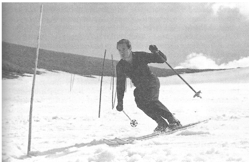
La tècnica de contra-espalla a finals dels '50.