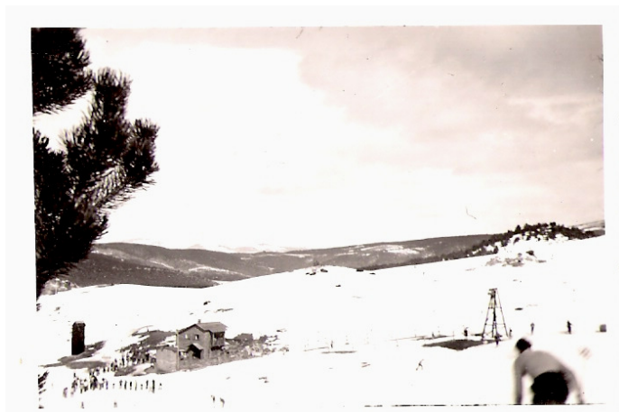
1946, Coll Sisè

I el 1948 es construeix el segon, el Telecadira de l'Estació, també de TEPSA, que s'interconnectava, més com a transport al tren que no d'esquiadors realment, amb el de la Perdiu a la caseta groga de la zona de la Font del Moreu, una altra família històrica de la muntanya, al costat de la Residència esportiva dels Quatre Vents, posterior. Ara ja es podia pujar en 25' de l'estació de tren a pistes en dues cadires.