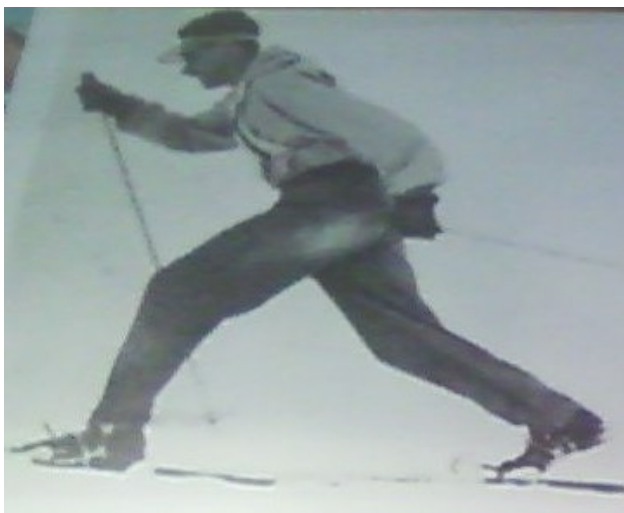
Taló lliure, tècnica per a nòrdic, esquí de muntanya, telemark...