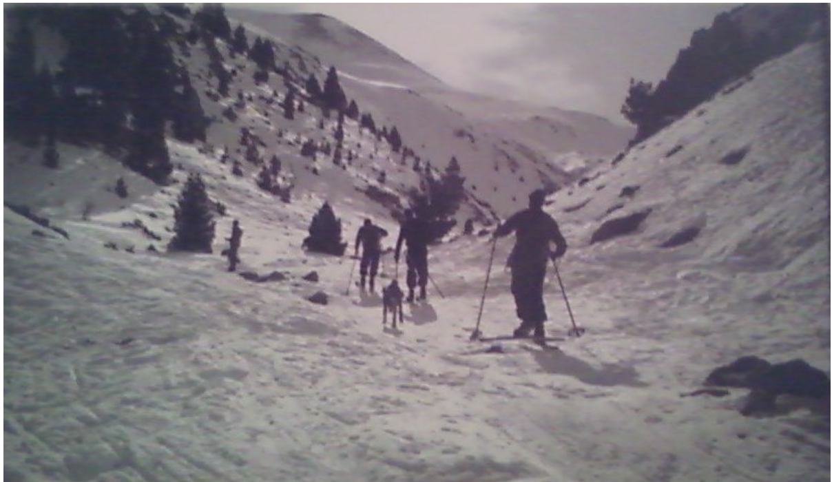
Tornant de Coll de Pal i Comabella...