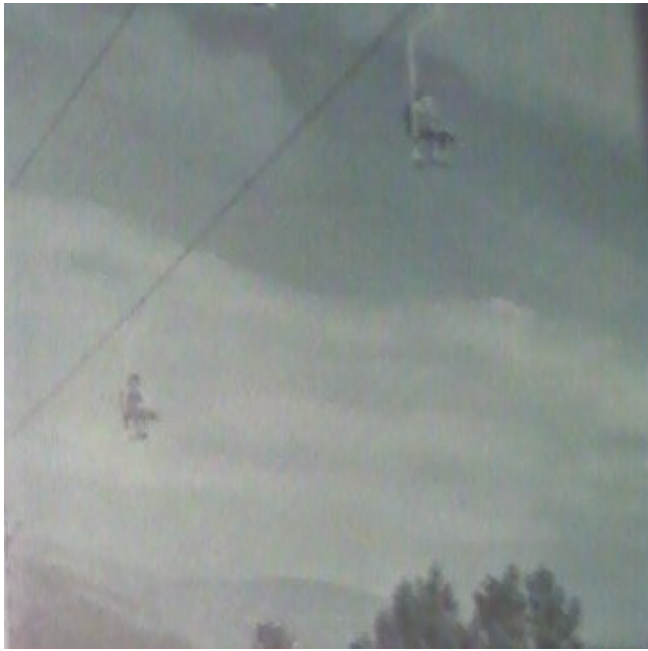
Telecadira de Costa Rasa des d'un altre punt de vista