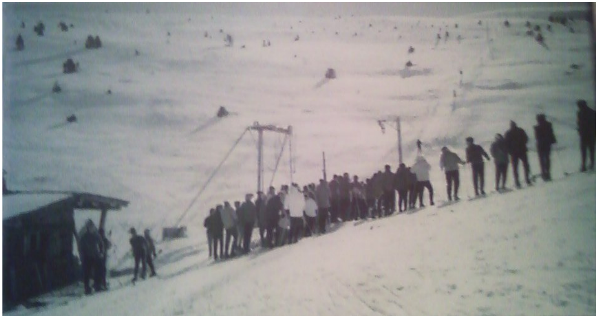
Cues per a agafar els primers remuntadors