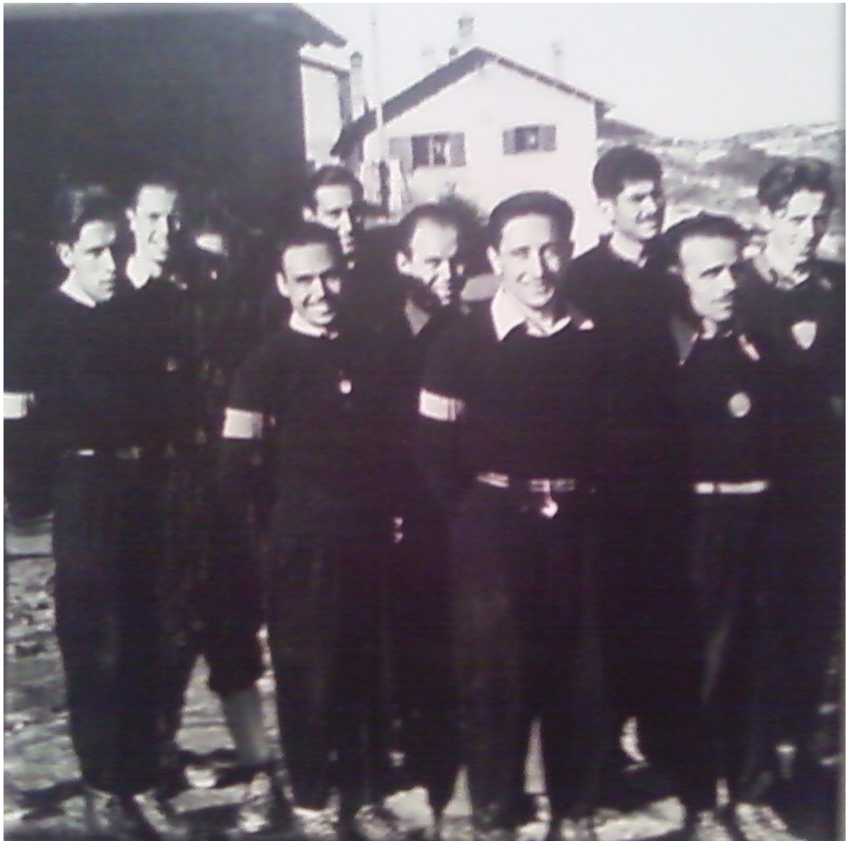
Els equips d'alpí i nòrdic del CEC, l'any 1946