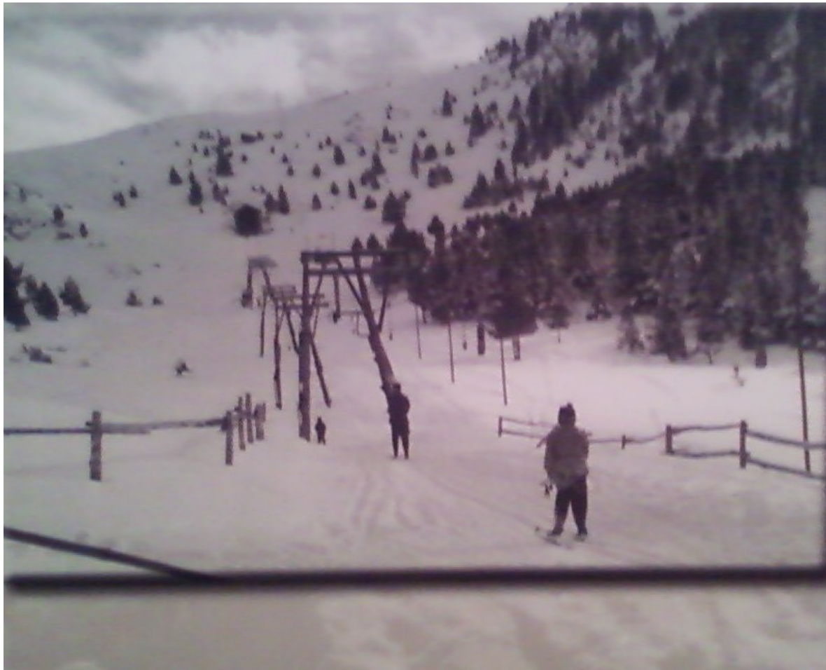
El primer remuntador de La Molina, amb les seves pilones en forma d'arc