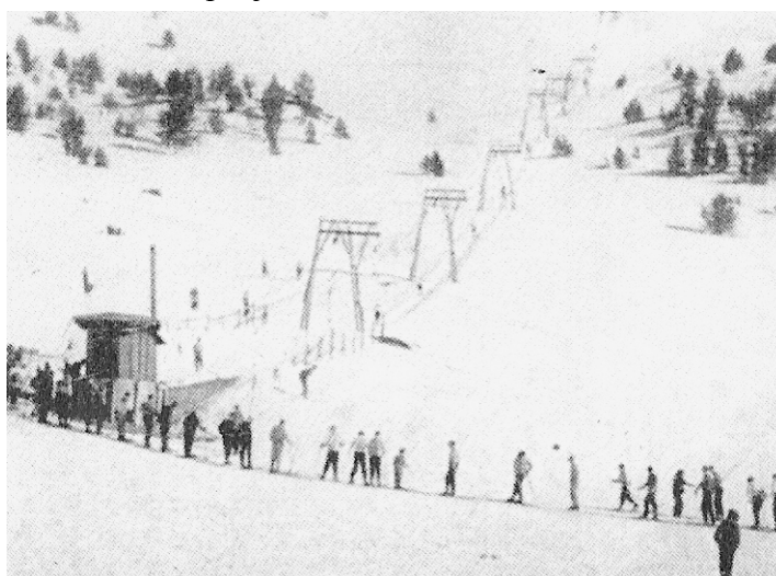
Cues ja per a agafar el primer remuntador a Font Canaleta