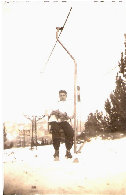
1946, s'inaugura el Cadira del Turó de la Perdiu, 22-12

I el 1948 es construeix el segon, el Telecadira de l'Estació, també de TEPSA, que s'interconnectava, més com a transport al tren que no d'esquiadors realment, amb el de la Perdiu a la caseta groga de la zona de la Font del Moreu, una altra família històrica de la muntanya, al costat de la Residència esportiva dels Quatre Vents, posterior. Ara ja es podia pujar en 25' de l'estació de tren a pistes en dues cadires.