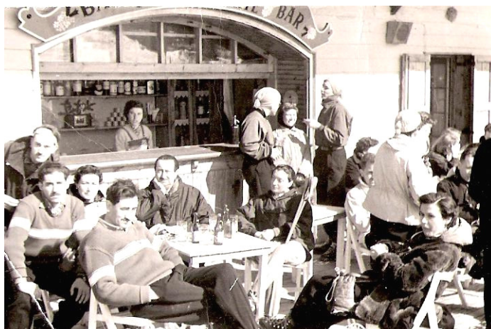
1948, "Bar de La Buena Suerte", interconnexió dels cadires

Convivint amb aquests rústics arrossegadors de troncs i similars i els més moderns posteriors, l'interès per l'esquí creix progressivament. El 1936 el francès Émile Allais (basat en Seelos) aplica una varietat de la rotació a la victòria a l'eslàlom del Campionat del Món d'aquell any, establint amb aquesta projecció circular (implantada a França i mitja Suïssa) una controvèrsia amb l'altre model imperant, l'austríac del joc de cames (implantat a Àustria, Alemanya, Itàlia, USA, Canadà i, fins i tot al Japó des del 1968). L'ensenyament de l'esquí comença a sortir de l'estancament en que es trobava: el 1942 una selecció d'esquiadors de la "Federación Española" visita Val d'Isère (avui a "Les Trois Vallées") i es queden meravellats de les tècniques que empren per a l'ensenyament. "Fou una revelació, per a nosaltres, el fet de veure organitzat, d'una manera seriosa i eficaç, l'ensenyament d'una tècnica que no deixava detall per analitzar", escrigué Alfons Segalàs a "Deportes de Invierno".