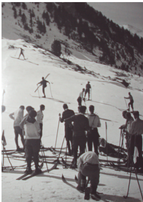
Observeu el del mig fent la Volta Maria amb unes pales de quasi 2 metres...