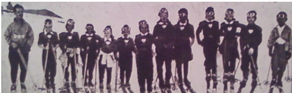
El primer any d'ensenyament d'esquí a La Molina, 1944, foren uns 150 els alumnes...