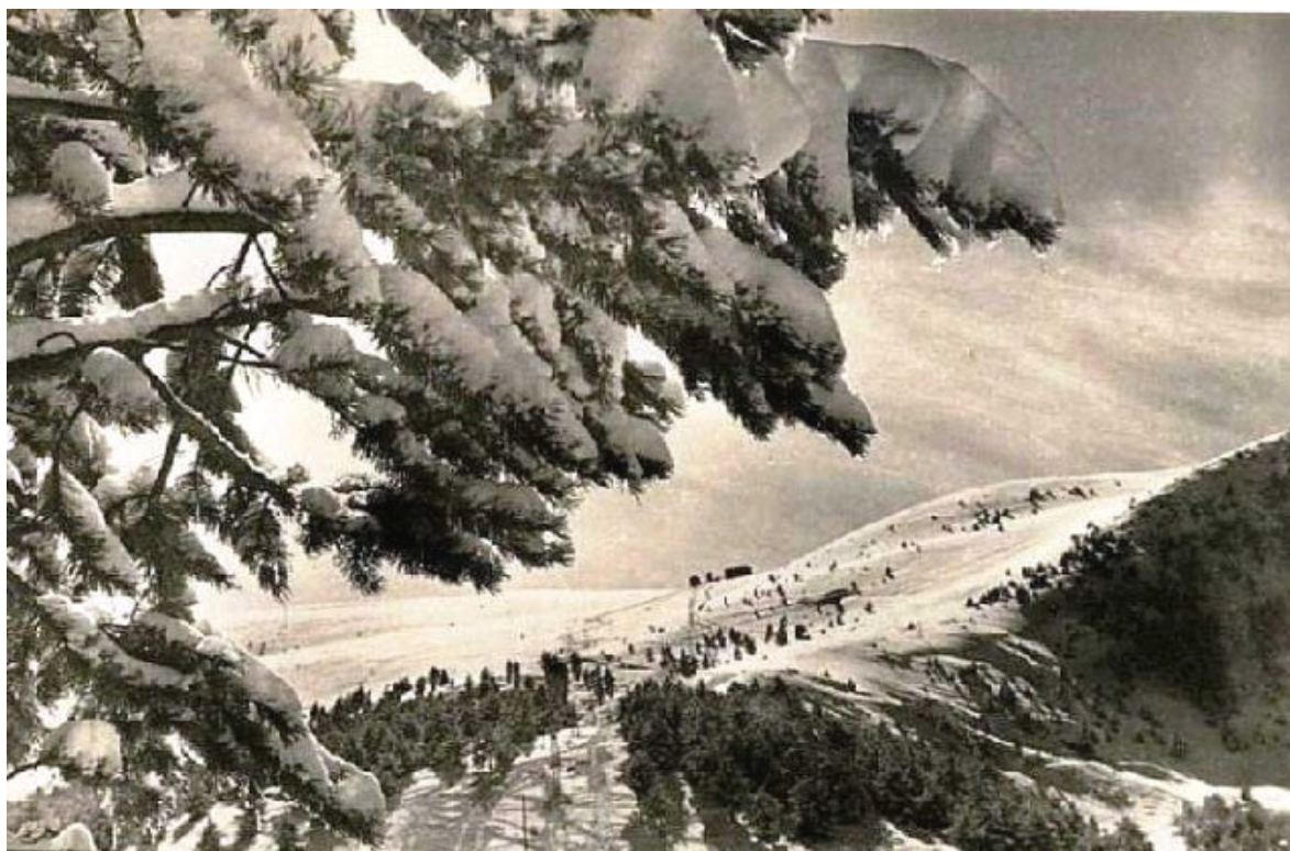
1953, aspecte general

El 1950 comencen les curses d'eslàlom gegant, s'integra la puntera de seguretat a la fixació de l'esquí i apareixen les fixacions d'acoblament automàtic ( step-in ), els cantells dels esquís es tornen més fins, seccionats o continus, i es generalitzen les soles de plàstic (polietilè). I l'Escola Suïssa crea el viratge paral·lel sense rotació de cos, alleugerint el pes. Més tard, les escoles d'esquí començaran a celebrar congressos. Des del 1950 ençà afloren notables millores tècniques, la puntera i fixació de seguretat, els esquís més curts (Karl Köller), etc.