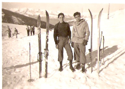
1944, esquiant el dia de Cap d'Any