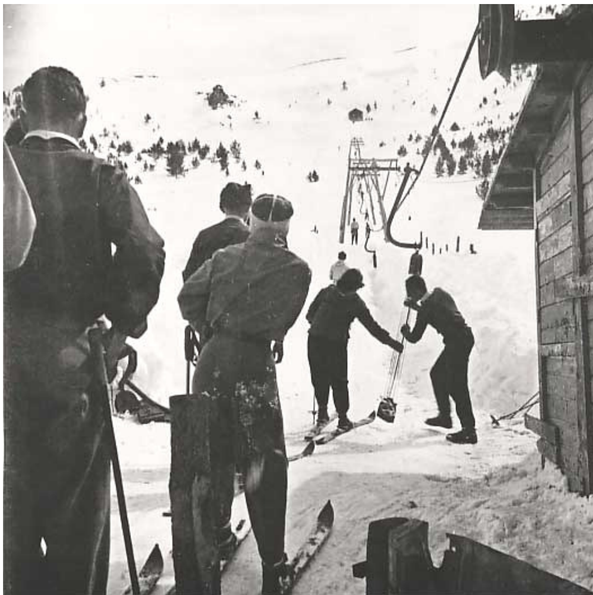
1943, 1er remuntador de La Molina