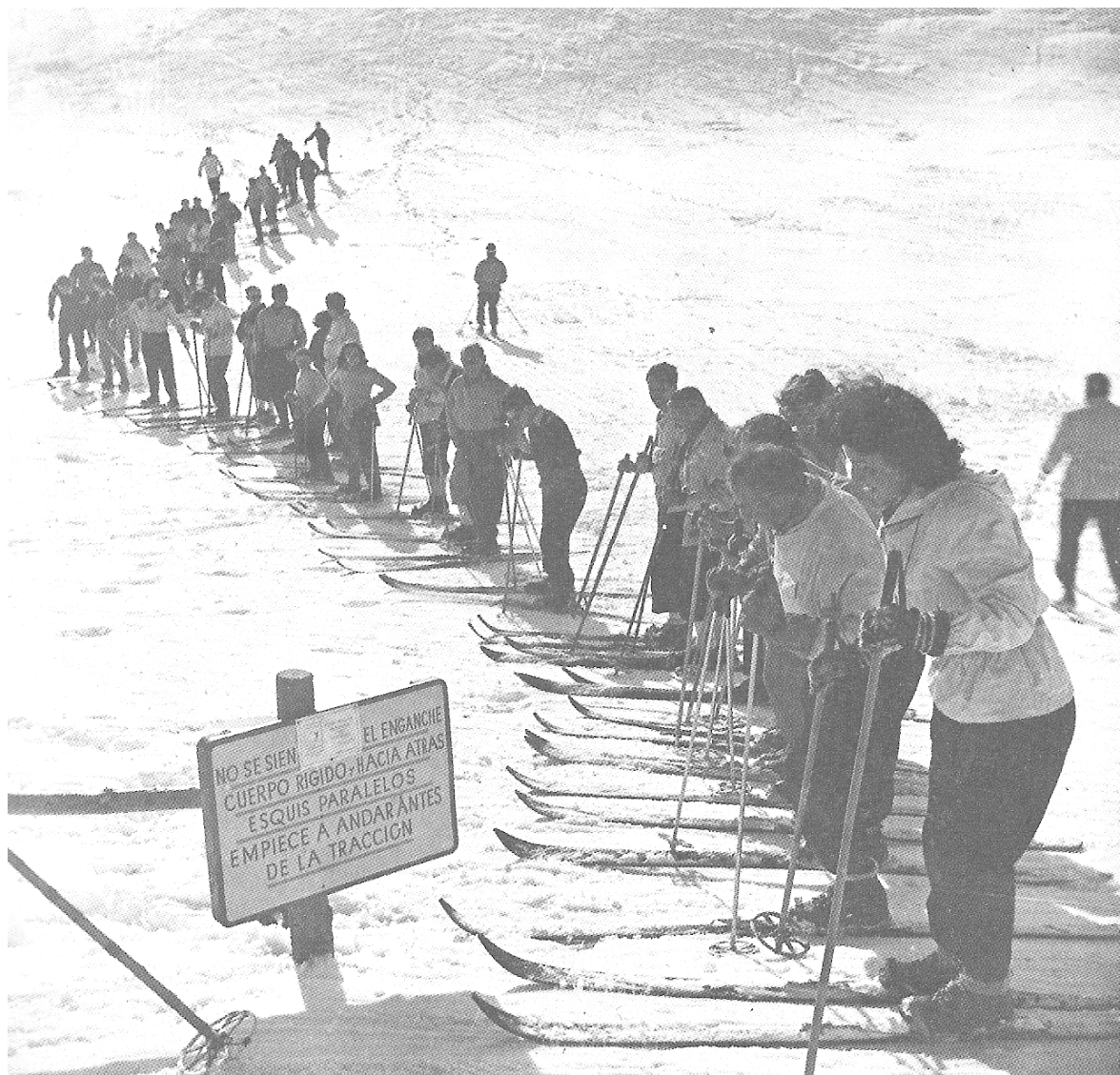
1944, arriben les primeres cues a Font Canaleta