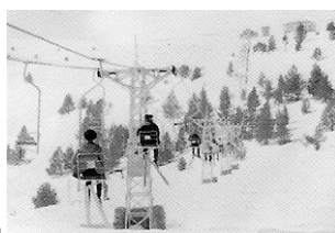
1948 +/-, assentats tranquil·lament al telecadira d'El Turó de la Perdiu