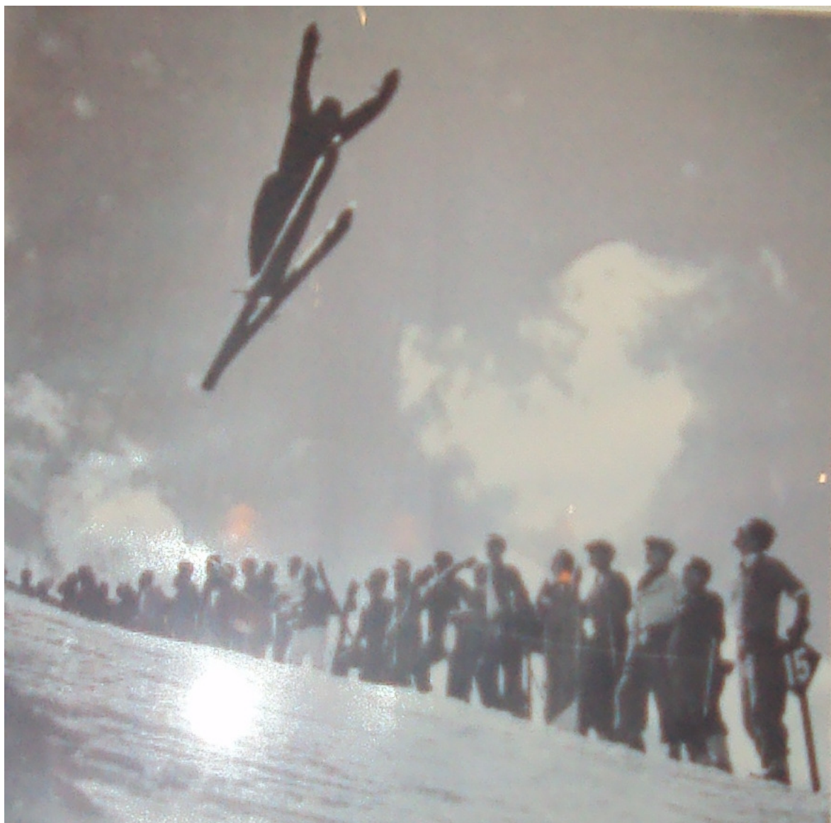
1934, Sigmund Ruud, campió del món de salts, al trampolí de Font Canaleta. El noruec saltà a La Molina, davant 3500 persones. Fou medallista a St. Moritz-28, campió als mundials de Zakopane-29 i subcampió a Oslo-30