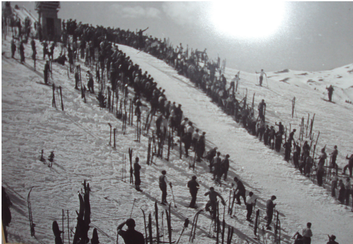
Trampolí de salts a La Molina