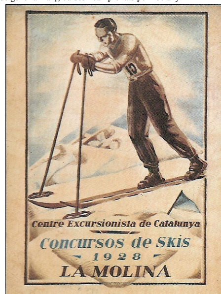
1928, concursos d'esquí