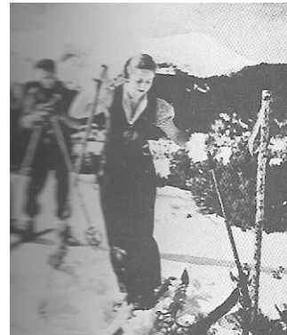
1935, desembre. Aquesta foto d'una noia bonica a La Molina va ser portada de l'almanac del CEC del '36