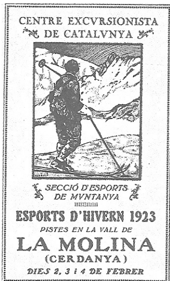
1923, Esports d'Hivern amb el CEC, 2 al 4-2