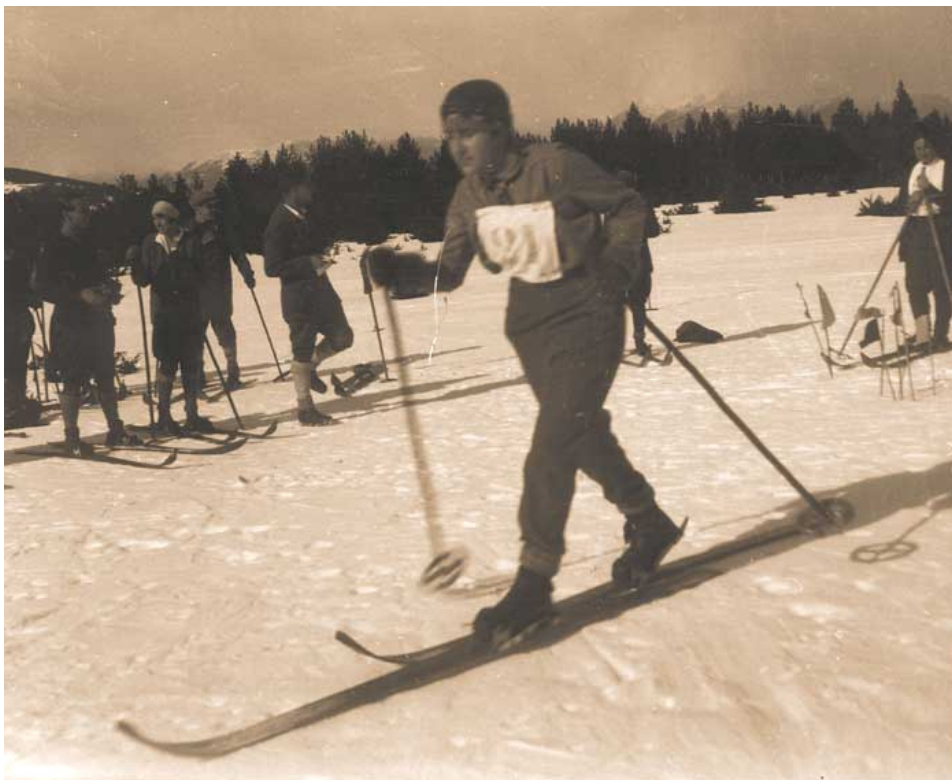
1931 +/-, nòrdic

El 22 de març del 1931 la "Compañía de Ferrocarriles de Montaña y Grandes Pendientes" inaugura el Cremallera de Núria, que permetrà l'extensió de l'esquí cap a aquell indret del Ripollès. El C.A.N. (Club Alpí Núria) es crea el 1932, originant-se llavors una important rivalitat Núria-La Molina. El C.A.N. acabarà essent C.A.N.M. (afegirà Masella el 1969), i C.A.N.M.-C. ("C" de Cerdanya). Avui, radicat a Puigcerdà, entrena a Masella i al Pas de la Casa, deixant Núria ja de banda des de fa anys.