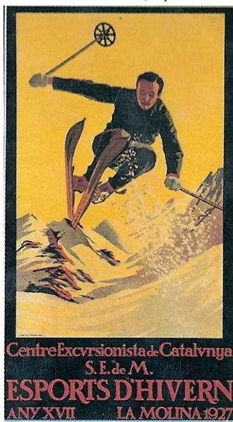
1927, a La Molina, i ja van 17 anys d'esquí...