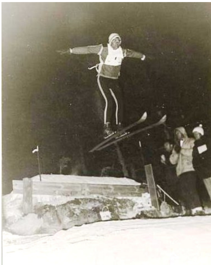
1962, Jocs Escolars CVN