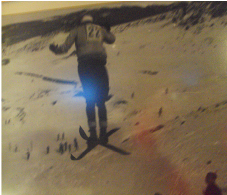
Salts a La Molina