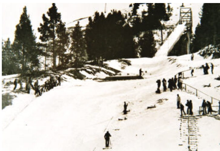
1935, trampolí Font Canaleta