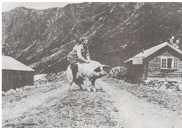
1935, quin porc!