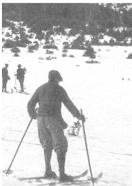
1928, a poc a poc

Va ésser declarat edificació singular de la muntanya, però avui està apuntalat en el seu interior i seriosament amenaçat en els seus fonaments, atacats pels pilots horitzontals d'una promoció de 120 apartaments aparellats (edificada per Constr. Juanes, promoguda per Habitat i finançada per la Corp. Ind. Banesto) situada davant d'ell i a l'esquerra de