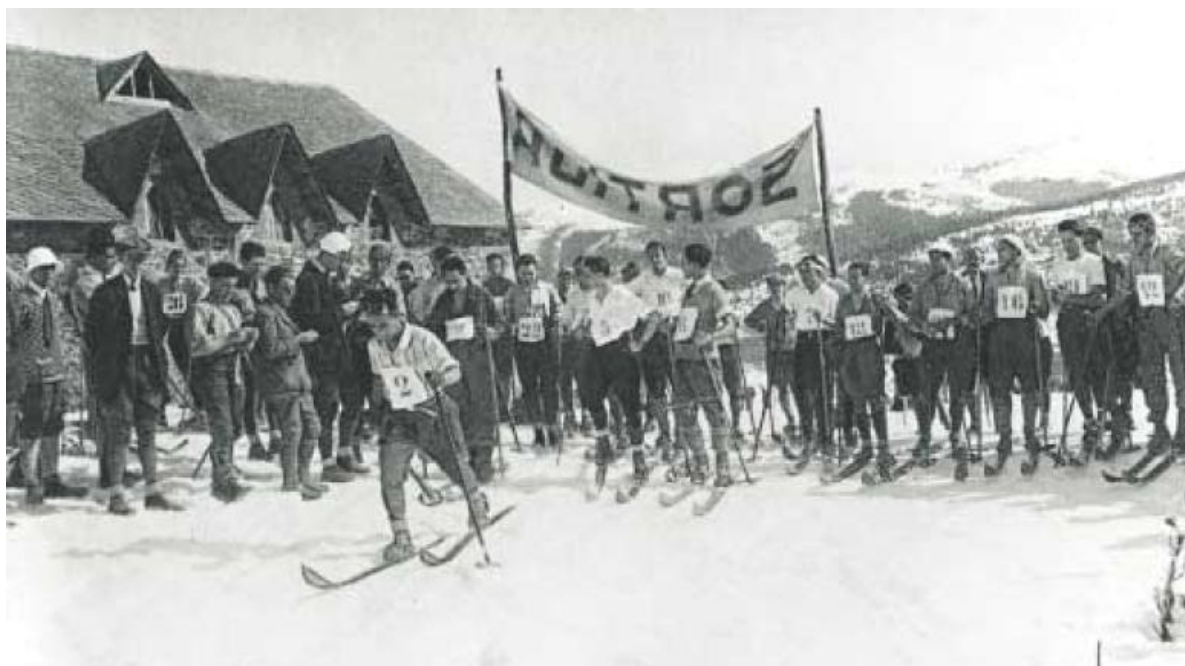
1925, sortida d'una cursa de fons davant del Xalet.