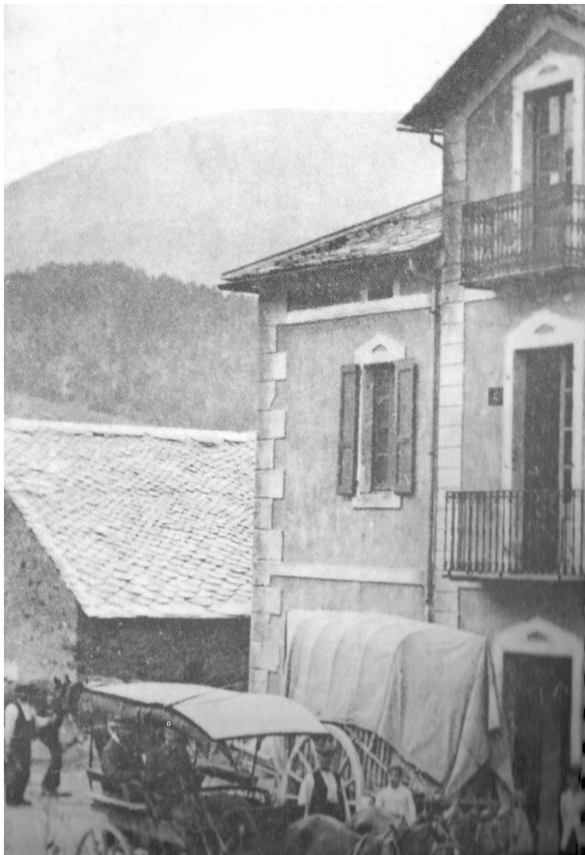
1929 +/-, una de les cases del Sitjar, per sota del CEC