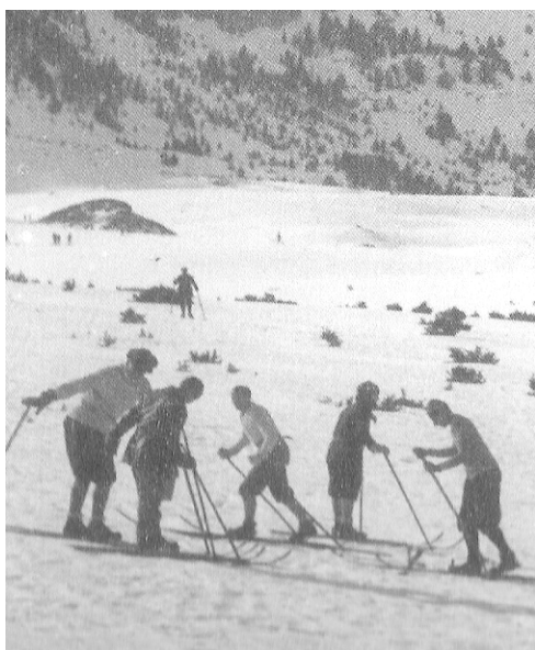
1927, Font Canaleta