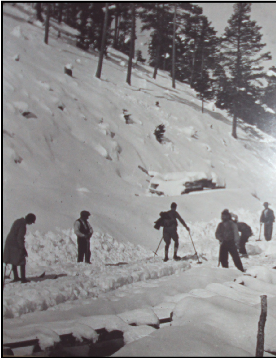
A finals dels '20...