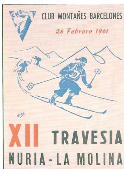
1961, 26-2, XII Travessa Núria - La Molina

Aquestes travesses no van tenir una continuïtat anual. Es celebraren esporàdicament en funció de les condicions climatològiques, el pressupost de que es disposava, la disponibilitat del llarg temps que requerien, la situació político-social, etc. Com a mostra, aquí teniu un cartell de la XII Travessa Núria-La Molina (1961), ja en el vessant esportiu de travesses, ral·lis i curses, competició endegada el 1947 i organitzada pel Club Muntanyenc Barceloní (CMB)... Fou un calendari de proves d'esquí d'alta muntanya que va assolir gran prestigi i popularitat.