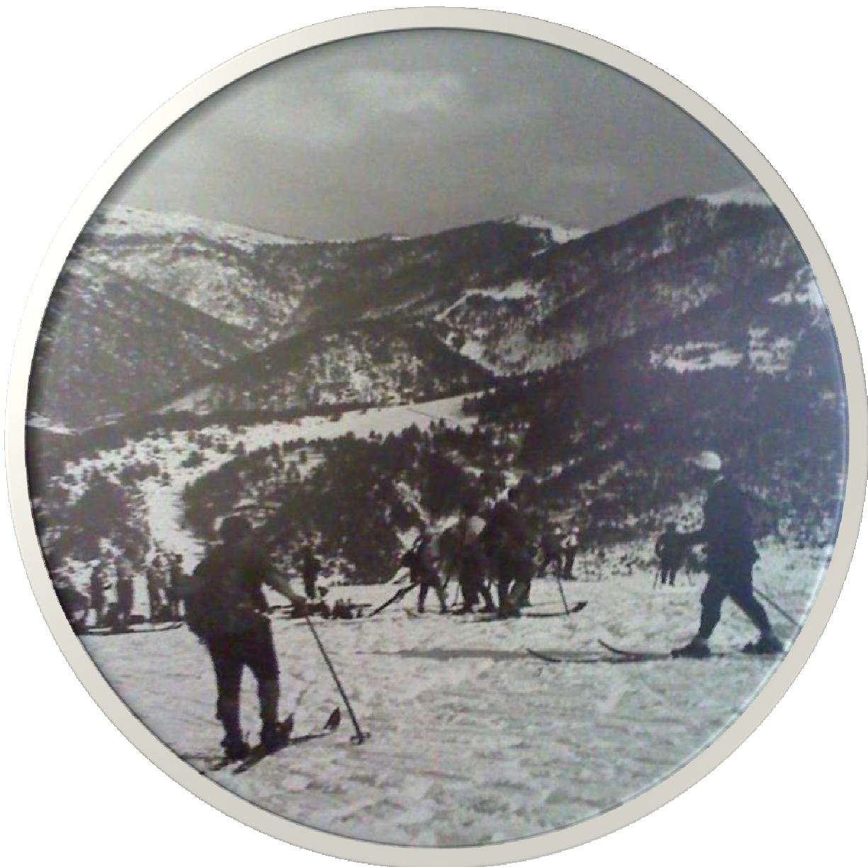
Déu n'hi do la quantitat d'esquiadors