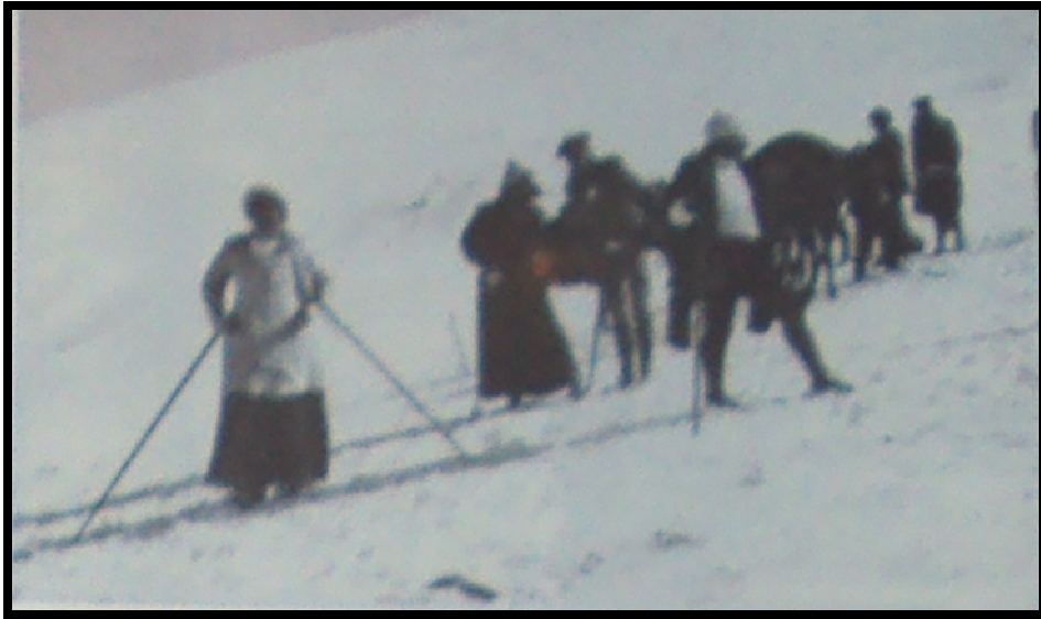
1921, les dones també esquien, i amb faldilla llarga