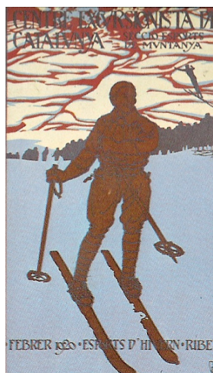
1920, febrer, concurs del CEC, secció Esports de Muntanya