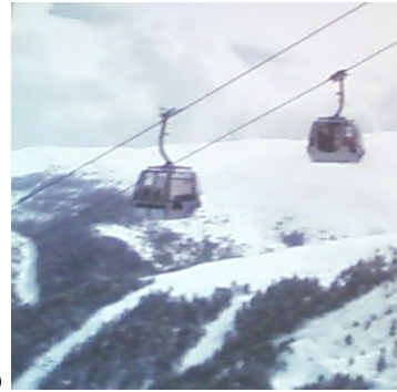
Telecabina Alp 2500