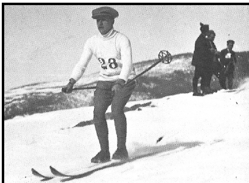
1916, esquí a Ribes