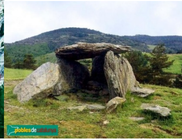
Dolmen d'El Paborde, 2000 aC

La “ Gran Setmana d’Esports d’Hivern a Ribes de Freser ”, del 29/1 al 5/2/1911, és el primer concurs esdeveniment esportiu, social i festiu que duu competicions a La Molina. Forma part del “ III Concurs de la Setmana Esportiva ”.