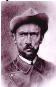
Il·lustració de Mathias Zdarsky segons el pintor Alberto Campos

L'esquí contemporani ens arriba a través de tècniques com el telemark (nom copiat de la regió on neix), inventat el 1850 pel noruec Sondre Norheim (de 24 anys, d'Overdal-Norheim, a la vall de Mordegal), tècnica avui en revifalla, passant de ser un mitjà de subsistència a constituir una activitat esportiva. Es considera la primera tècnica d'esquí de pendent, i s'estendrà gràcies al fenomen de l'emigració a Centre Europa, Nord Amèrica i Japó especialment. 30 anys més tard ell mateix inventarà la primera fixació, encara rudimentària, i, a l'any següent, els instructors de la regió noruega de Telemark inauguren la primera escola d'esquí. Ja als Alps, a finals del s. XIX, l'austriac Mathias Zdarsky, influït per el citat relat de l'aventurer i expedicionari Fridjot Nansen, concep un nou material per a l'esquí (fixacions i tècnica, base de l'esquí actual), i desenvolupa la tècnica d'un sol bastó, arribant fins i tot a organitzar el 1905 una mena d'eslàlom.