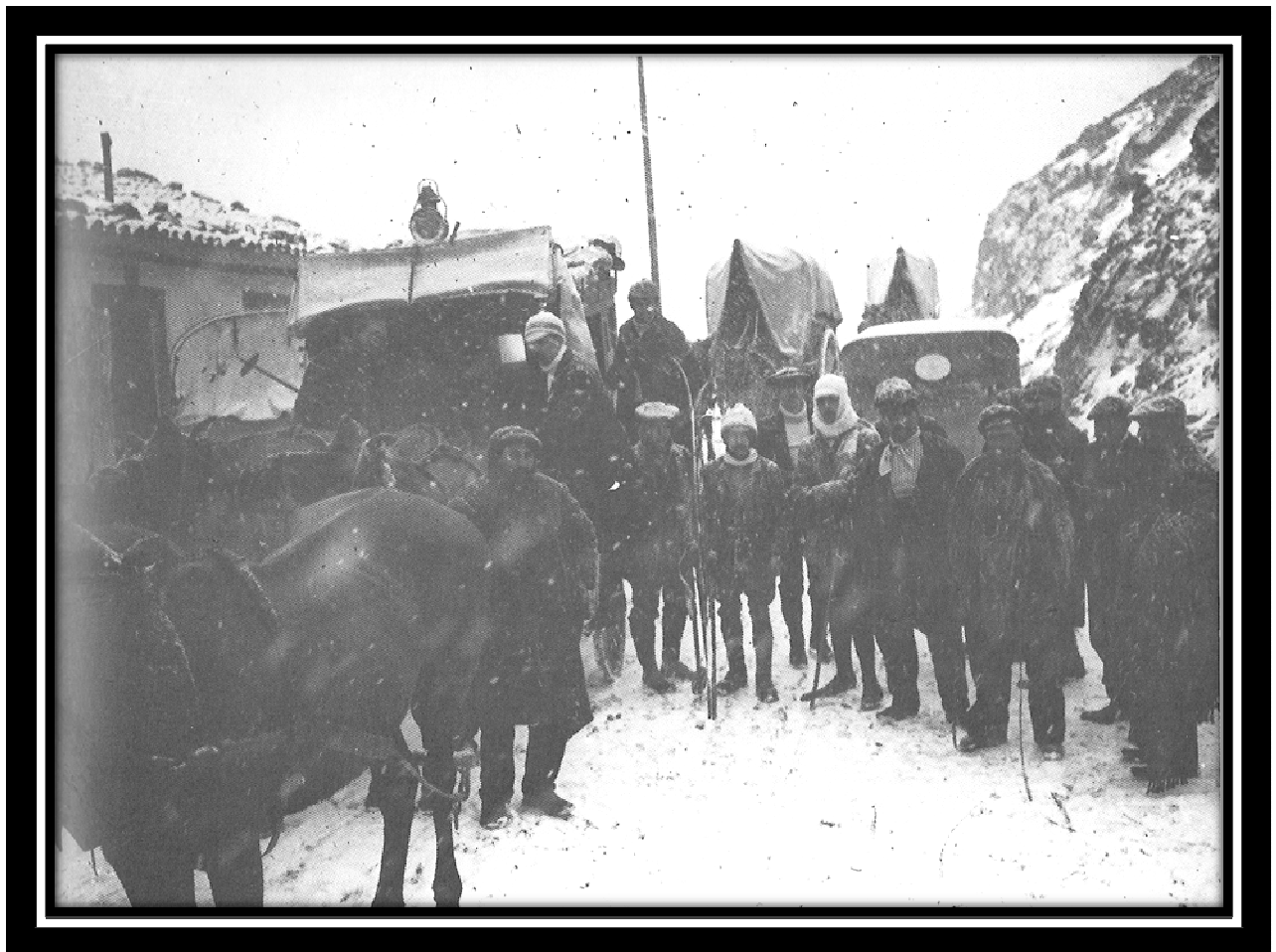
1911, febrer, on acabava la carretera de la Collada, a punt d’iniciar la cursa de la Gran Setmana d’Esports d’Hivern. Es pujà amb autos llogats...

La “ Gran Setmana d’Esports d’Hivern a Ribes de Freser ”, del 29/1 al 5/2/1911, és el primer concurs esdeveniment esportiu, social i festiu que duu competicions a La Molina. Forma part del “ III Concurs de la Setmana Esportiva ”.