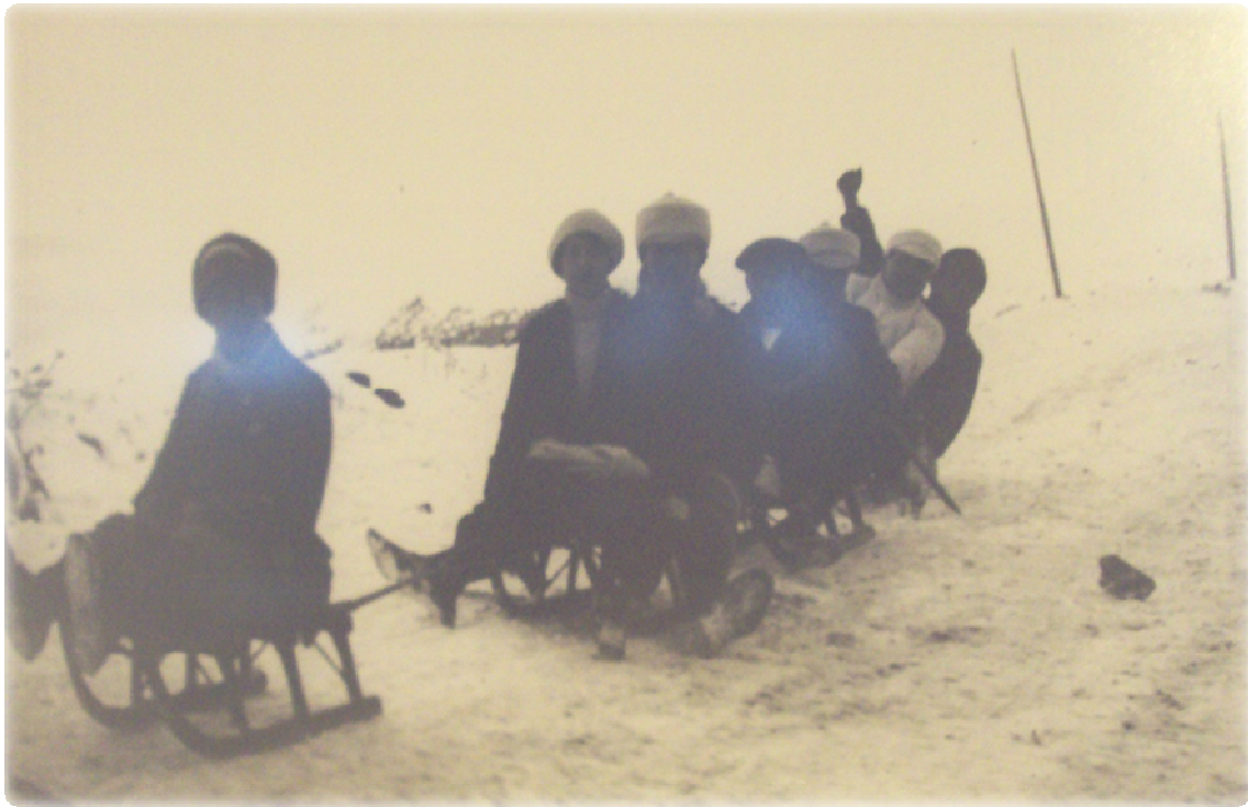
Luges i trineus de fa 95 anys