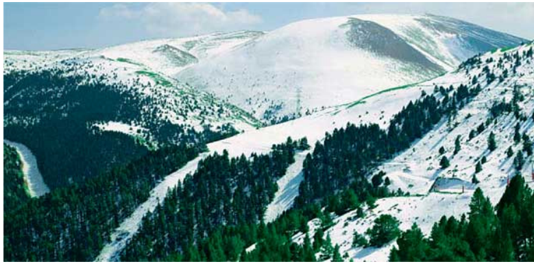
La Molina i el Puigllançada des de Masella. La Volta a Muntanya Sagrada cau a l'esquerra